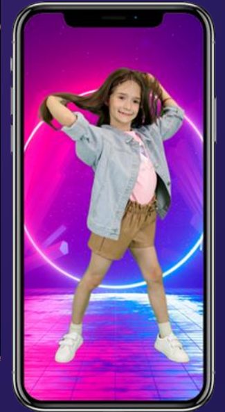
Церемония награждения "Miss MMTV"